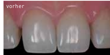
Patient mit Diastema