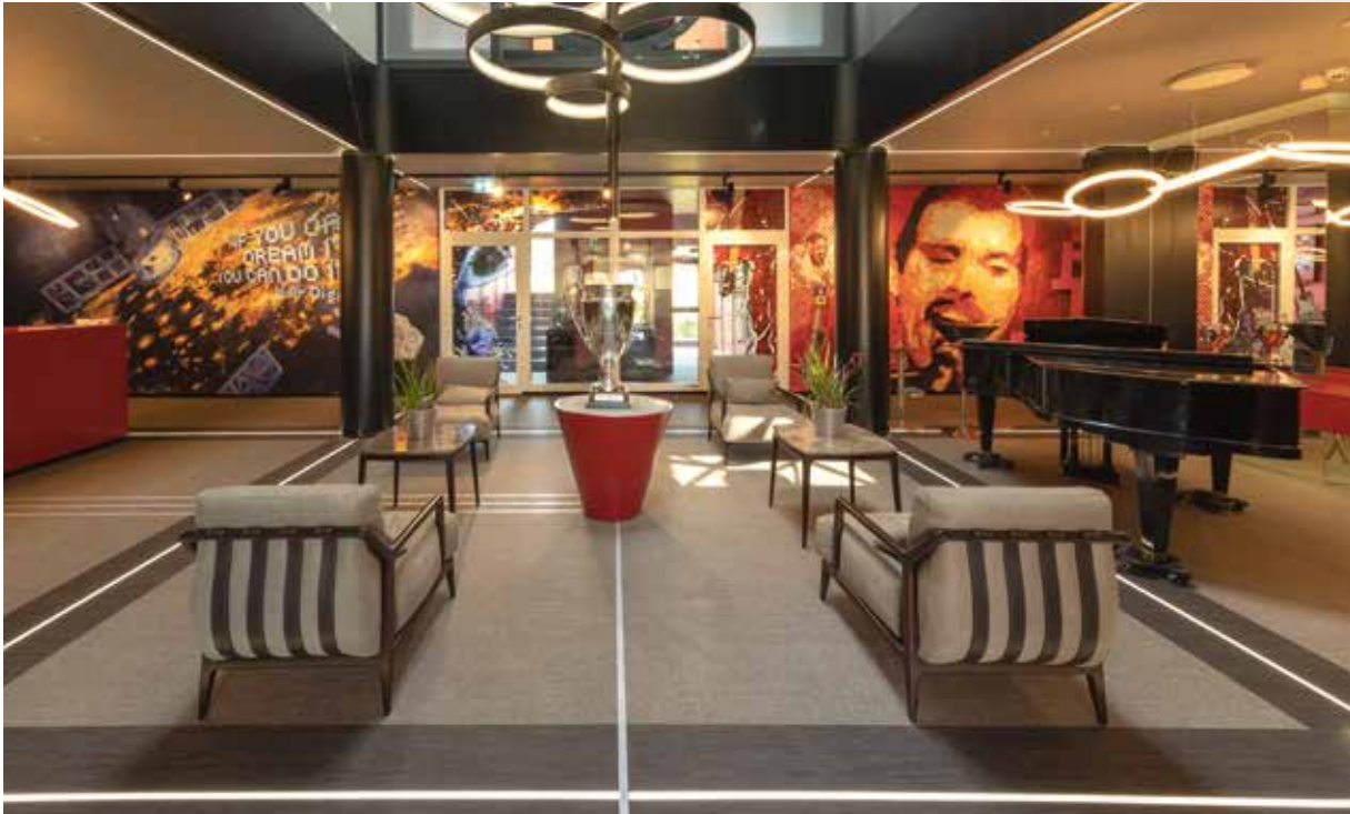
Film: Das Future Center in Flonheim