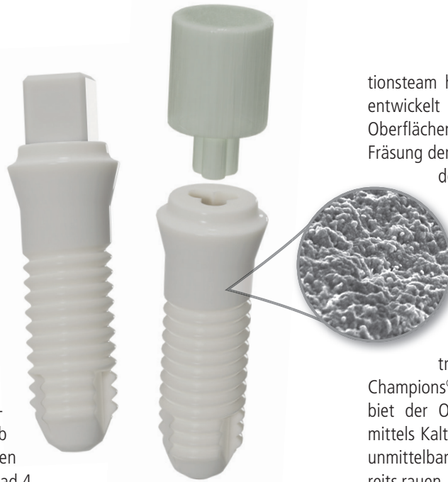
Abb. 2: Das BioWin! ist ein- oder zweiteilig erhältlich und überzeugt mit einer patentierten, mikrorauen Oberfläche.

Ich lehne auch pseudowissenschaftliche Patienten-Medikamenten-Substitutionen, Infusionen und Konditionierungen von z.B. völlig überhöhten Vitamin-D3-Gaben ab. Dies führt zu einer