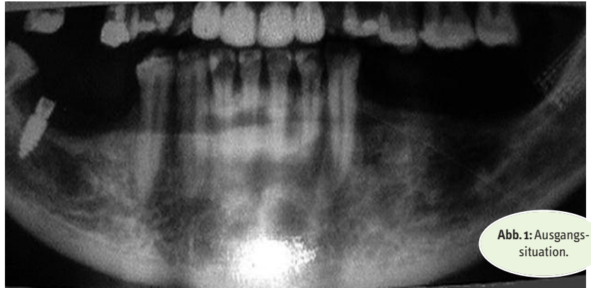
Abb. 1: Ausgangssituation.

In ihren Anfängen galt die Implantologie als chirurgisches Nebenfach als reine Männerdomäne. Sie wurde damals von mutigen und chirurgisch versierten Zahnärzten entwickelt und in der Zahnheilkunde etabliert. Obwohl in den beiden letzten Jahrzehnten 70 % der Zahnmedizin-Absolventen Zahnärztinnen waren, ist noch immer der Großteil der Implantologen männlich. Fast scheint es also, dass allen Emanzipations- und Gleichberechtigungsdiskussionen zum Trotz in der Implan-