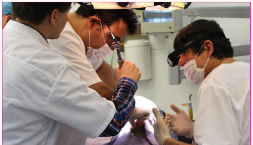
Diese Referenten reden nicht nur.

Anhand zahlreicher Fall- und Filmbeiträge konnte den Teilnehmern dann anschaulich gezeigt werden, dass die MIMI-II Technik bei etwa 15% aller Praxisfälle wesentliche Vorteile mit sich bringt: Mit extrem schmalen Diamanten und einer ausreichend wassergekühlter Turbine schafft man sich über die Gingiva und die ersten 1-3 Millimeter Kompakta von oral kommend einen Zugang in die Spongiosa. Mit dem mit nur 20 U/Min sehr niedrigtourigen gelben Bohrer oder eventuell vor-