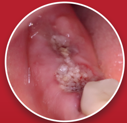
Das Material verwächst sich mit der Zeit zu Knochen

Alle Produkt- neuheiten finden Sie hier: